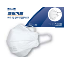
크린가드* M10 접이식 방진마스크