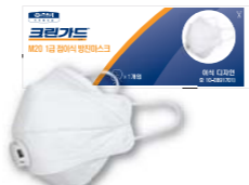
크린가드* M20 접이식 방진마스크