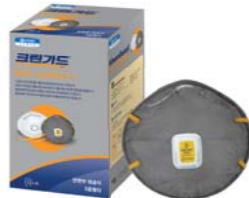
크린가드* M20C 방진마스크