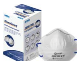
크린가드* M10 방진마스크