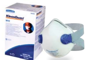
크린가드* M10 Diva 방진마스크