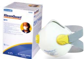
크린가드* M20 Diva 방진마스크