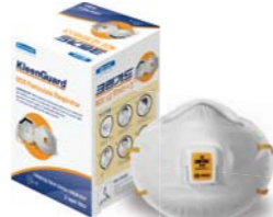
크린가드* M20 방진마스크