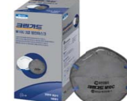
크린가드* M10C 방진마스크