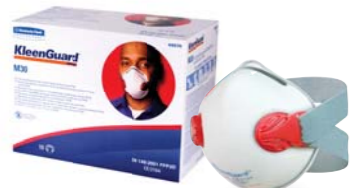
크린가드* M30 Diva 방진마스크